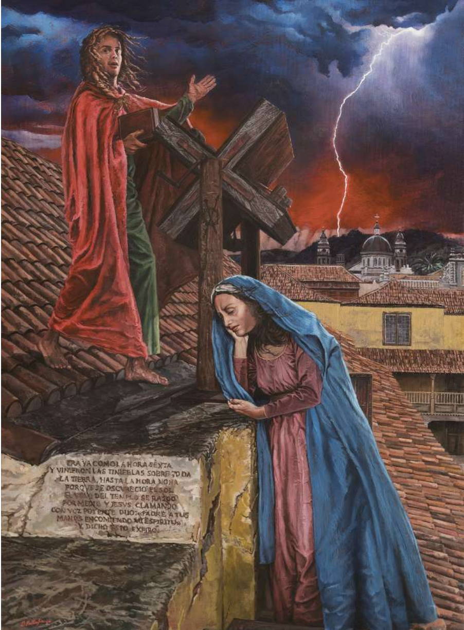
Hora sexta , óleo y acrílico sobre lienzo, año 2024.