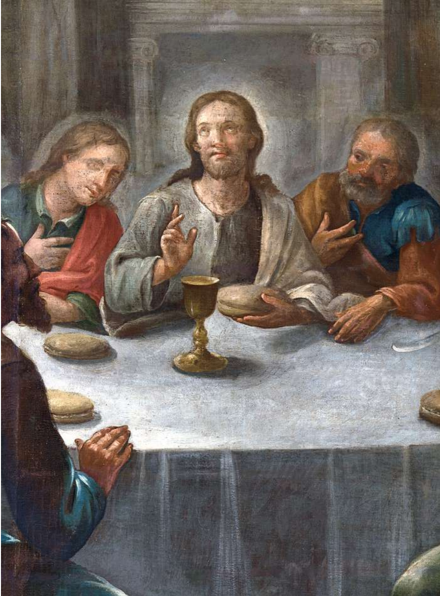
Detalle, Última Cena . Catedral, San Cristóbal de La Laguna.