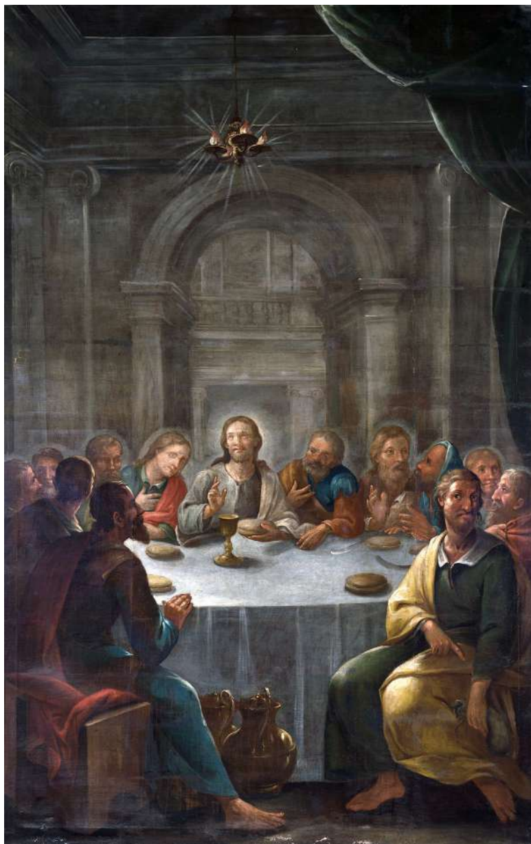
Fig. 2. Última Cena. Catedral, San Cristóbal de La Laguna.