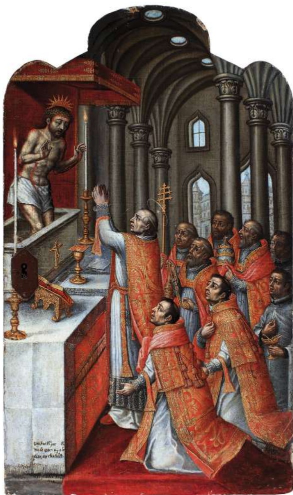
Misa de san Gregorio . Cristóbal Hernández de Quintana. Tenerife, 1725. Catedral de Nuestra Señora de los Remedios, San Cristóbal de La Laguna.