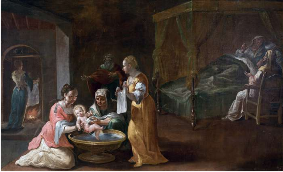
Fig. 5. Nacimiento de la Virgen . Catedral, San Cristóbal de La Laguna.

21: 2-11), interpretado por último como el trato oferente de Abraham hacia Melquisedec (Génesis, 14: 18-24) 12 .