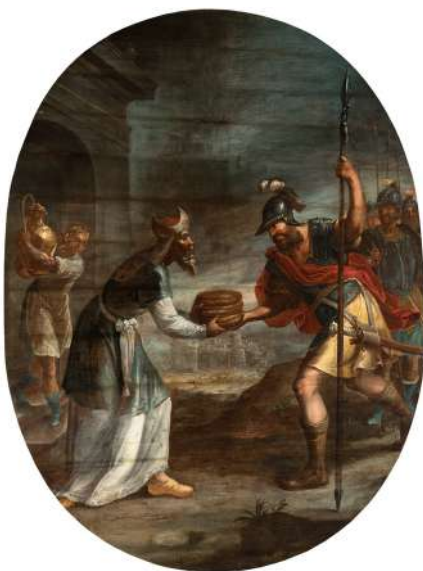
Fig. 3. Encuentro de Melquisedec. Catedral, San Cristóbal de La Laguna.