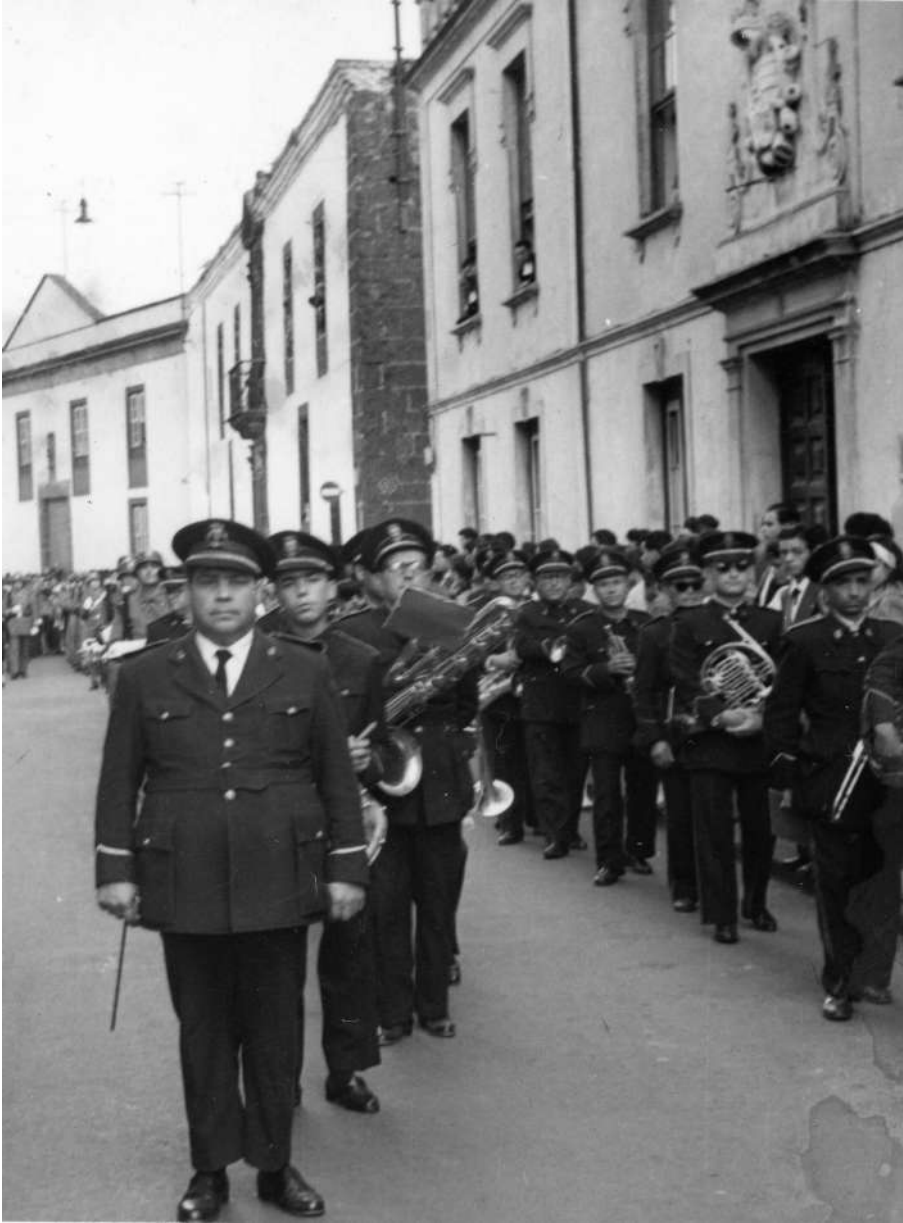
Banda Municipal de La Laguna.