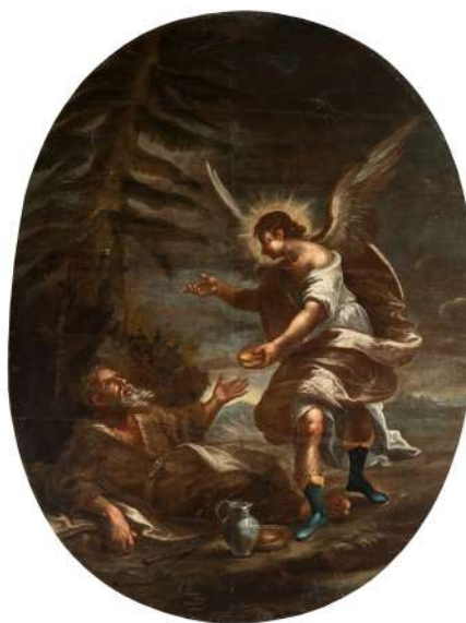
Fig. 4. Elías alimentado por un ángel. Catedral, San Cristóbal de La Laguna.

La temática de las representaciones pudo ser elegida por los clérigos de la parroquia y el propio artista, de modo que Miranda concebiría un conjunto o corto repertorio iconográfico donde el nexo común es el pan sagrado a través de varios pasajes de la Biblia. Así, a la institución de la eucaristía que realizó el propio Cristo y rememora el cuadro central de la Santa Cena conforme a lo estipulado en los relatos evangélicos (Mateo, 26: 17-35; Marcos, 14: 12-26; Lucas, 22: 1-38), se unen episodios que inciden en los antecedentes de ese importante acontecimiento como manifestación palpable del auxilio divino por medio del milagro de Elías alimentado por un ángel (Reyes, 19: 5-7) o, más cotidianamente, como ofrenda perenne de salvación a través de un episodio donde quedó descrito sin ambientación específica el encuentro entre David y Ahimelec (Samuel,