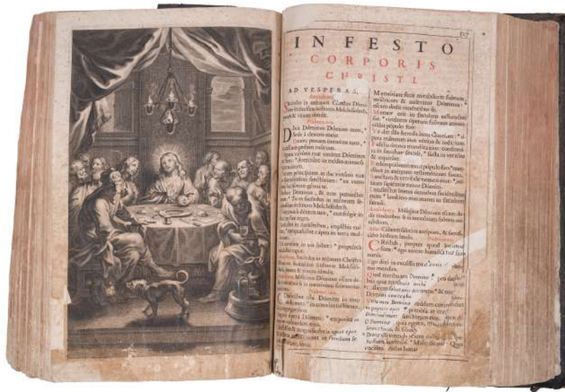
Fig. 1. Misal. Parroquia de Nuestra Señora de la Encarnación, Santa Cruz de La Palma.

antagónicos de fe y razón. Podría decirse que tal premisa resume los cambios que el clero reformista o más avanzado promovió en el ocaso del Antiguo Régimen, pero al mismo tiempo dicha dinámica esconde un programa ambicioso por la necesidad que hubo de limitar el protagonismo concedido a las representaciones sacras, adoctrinar mejor a los fieles y, muy especialmente, corregir los abusos cometidos con ciertas prácticas religiosas 6 .