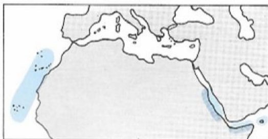
Distribución del drago ( dracaena draco ) y sus parientes más cercanos.

El drago es una planta de características primitivas que actualmente vive de forma natural en algunos archipiélagos macaronésicos: Madeira, Canarias y Cabo Verde. Sus parientes más próximos se encuentran en el Este de Africa y en la isla de Socotora.