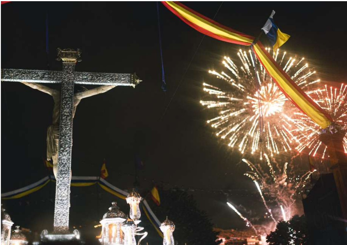
Exhibición pirotécnica de la Octava del Santísimo Cristo de La Laguna, 21 de septiembre de 2023.

A su término, PROCESIÓN de la Venerada Imagen del Santísimo Cristo de La Laguna por el recorrido de costumbre. Al llegar a la Plaza del Cristo, la Imagen se colocará para contemplar la exhibición pirotécnica, “Fuegos de la Octava”.