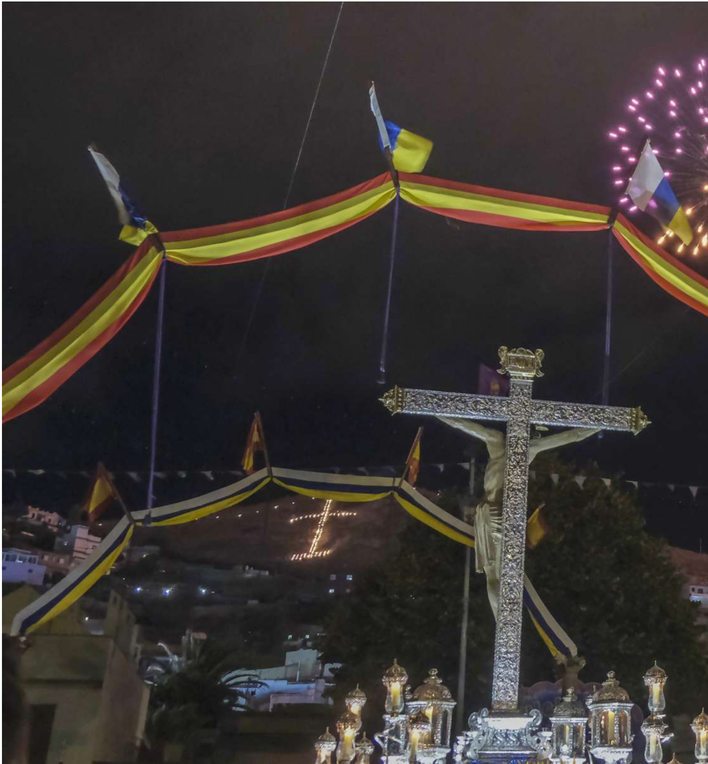
Exhibición pirotécnica de la Octava del Santísimo Cristo de La Laguna, 21 de septiembre de 2023.