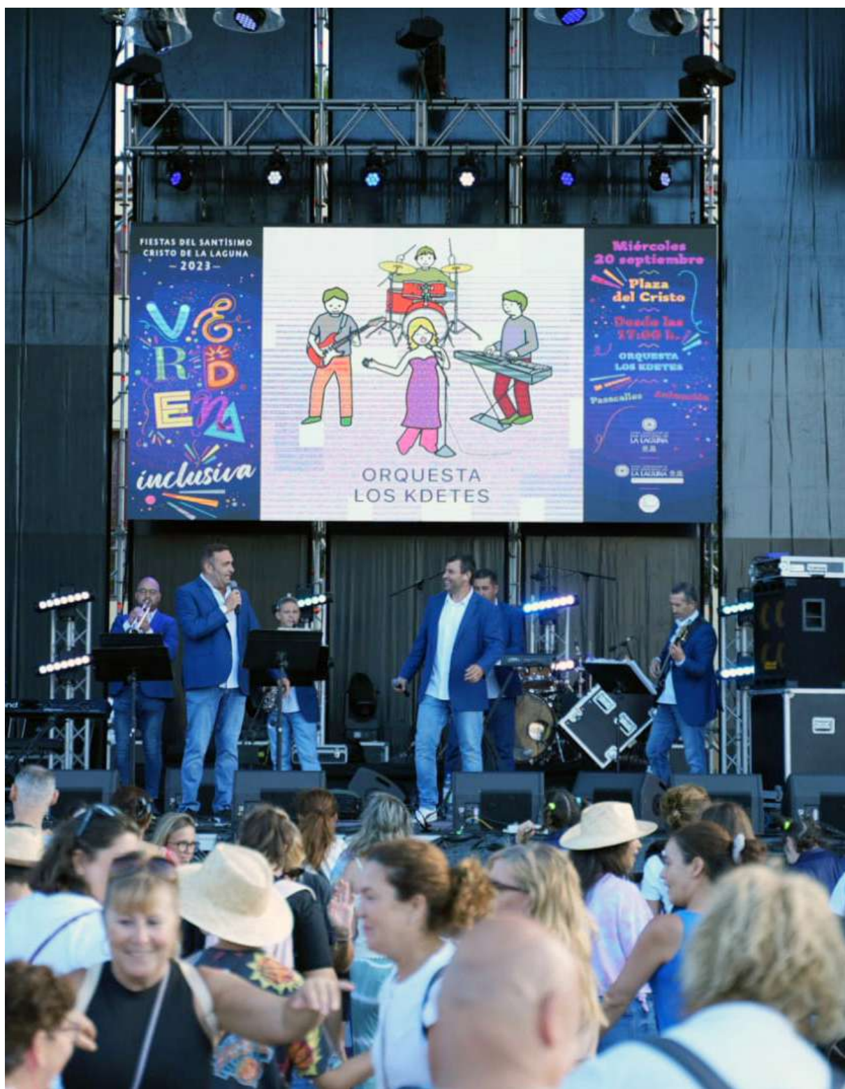
Il Verbenas inclusiva, septiembre 2023.