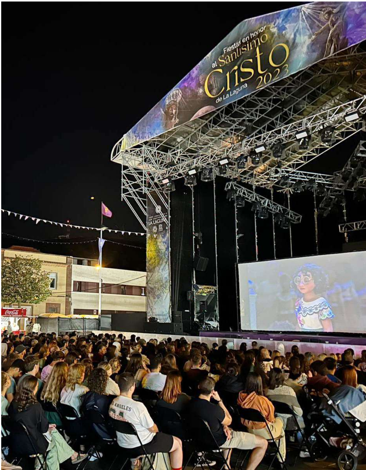
Noche de cine al aire libre, septiembre 2023.