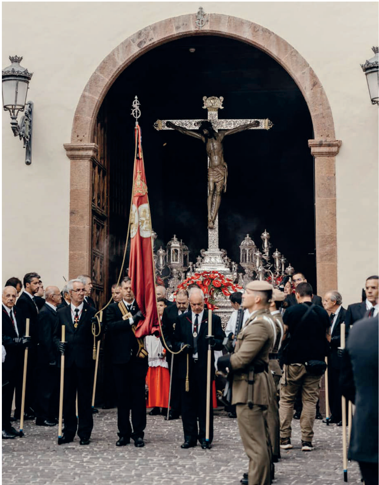
Imagen del Santísimo Cristo de La Laguna saliendo de su Real Santuario la tarde del 9 de septiembre de 2023.