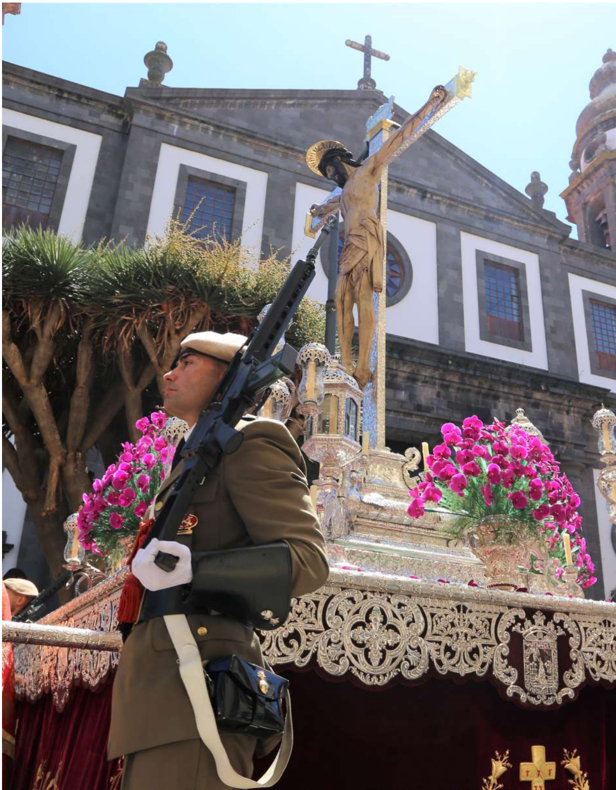
Procesión del 14 de septiembre a la salida de la S.I. Catedral