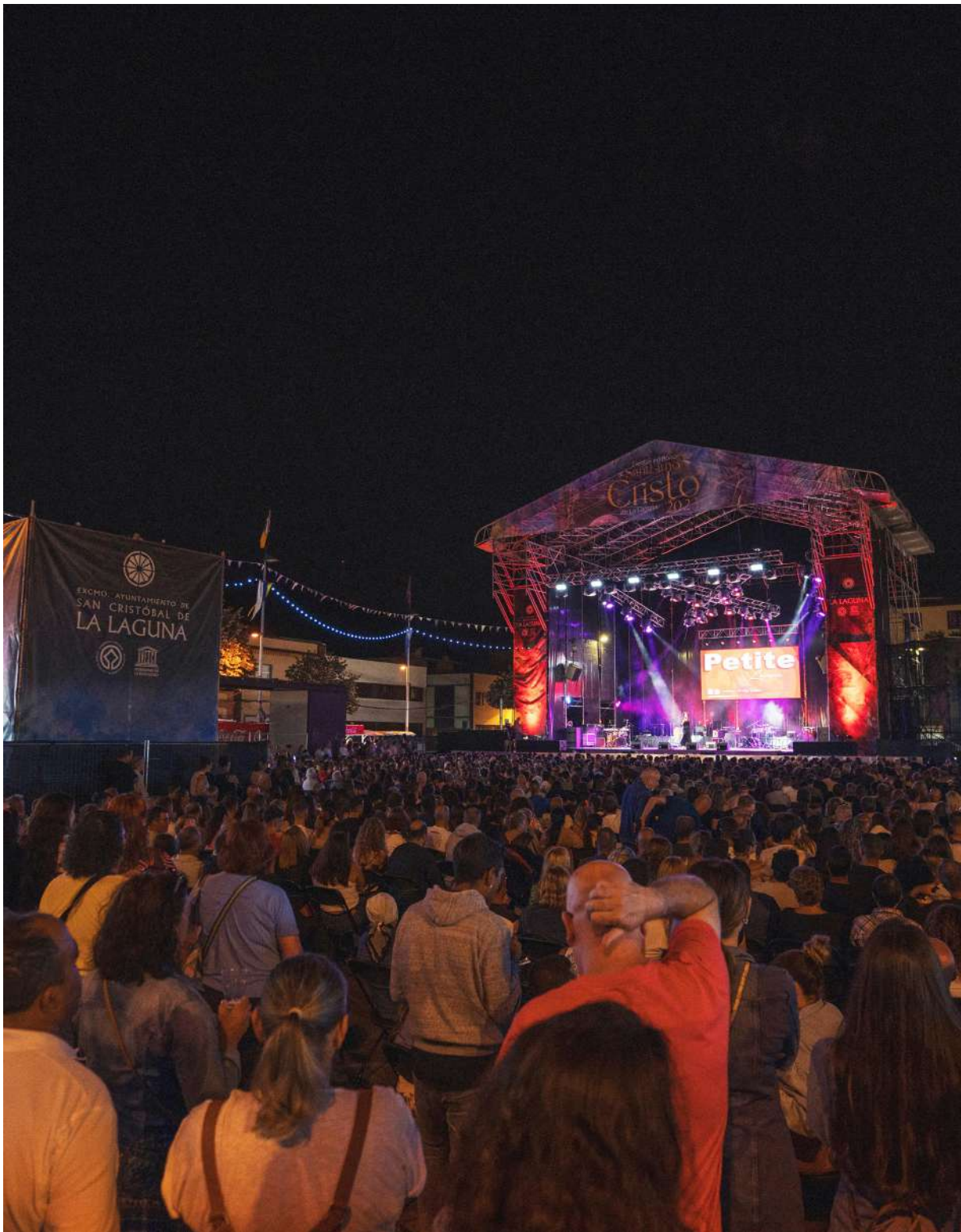
Noche de humor, septiembre 2023.