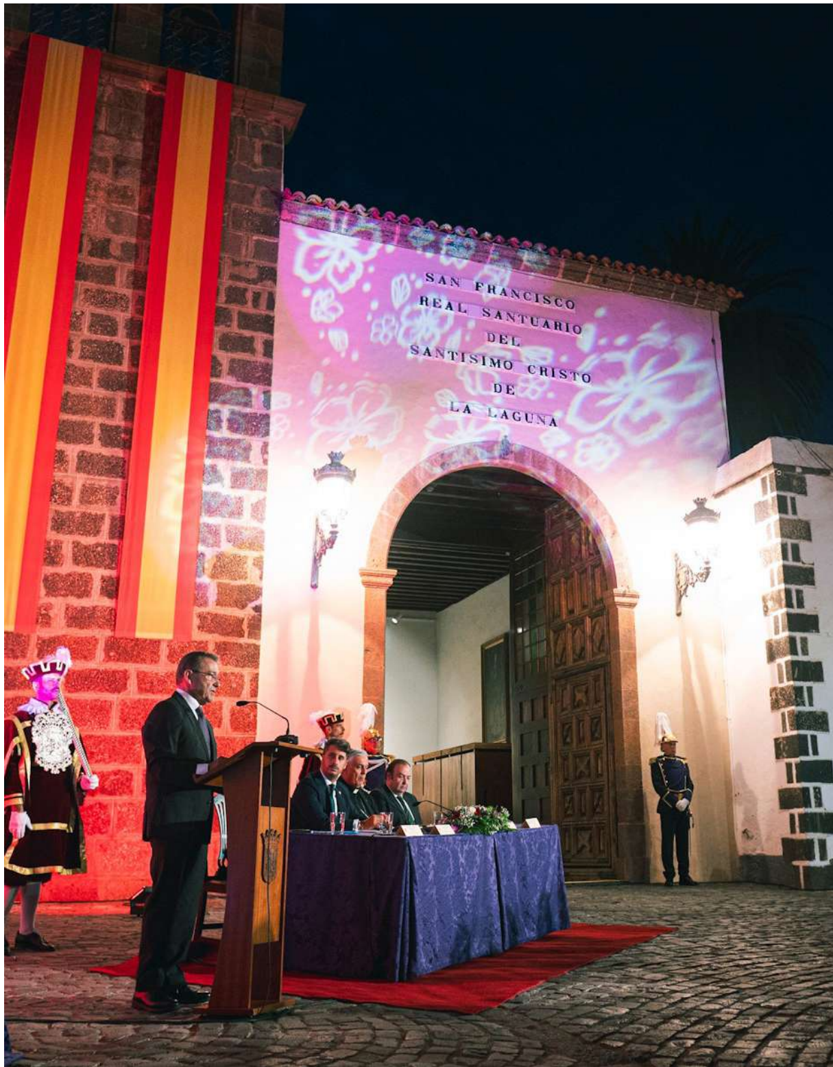
Acto de lectura del pregón de las Fiestas del Santísimo Cristo de La Laguna 2023.