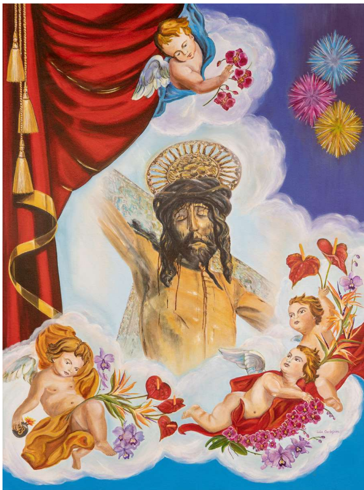
Óleo sobre lienzo que ilustra el Cartel de las Fiestas del Santísimo Cristo de La Laguna 2024, obra de Lola Carbajosa.