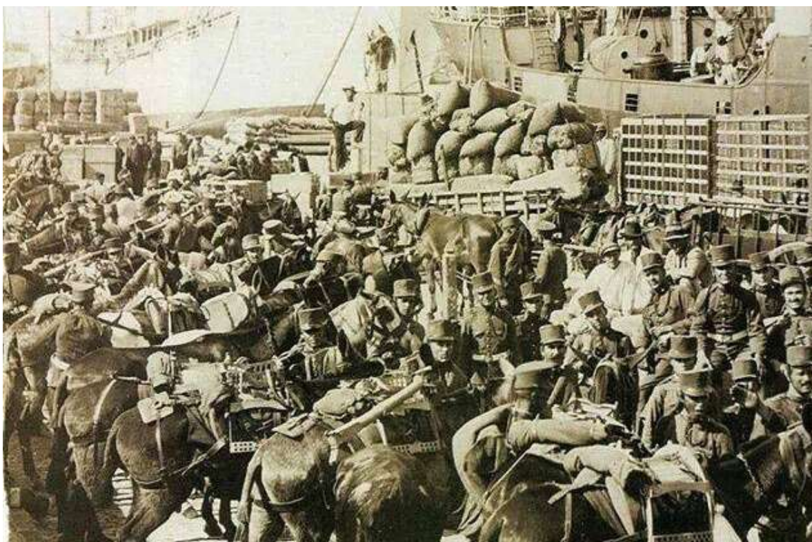
Embarque de la Batería de Montaña, 1921.

conducción de convoyes y marchas de entrenamiento; interviniendo en 17 combates, algunos especialmente duros, como son los de Gonas, Adrú y Afenin, pero especialmente el de Feddan-Yebel que se inició de madrugada y se prolongó durante 18 horas, sufriendo un significativo número de heridos y muertos de soldados encuadrados en otras Unidades. Penosa fue también la marcha desde Mexerah, con unas muy difíciles características orográficas del terreno, y donde tuvieron que hacer frente a numerosos ataques de rifeños, llegando finalmente a Tazarot, guarida del célebre Xerif el Raisuni, cuyo cuartel general fue derrotado y destruido, llenando de gran satisfacción a la Batería lagunera por haber tomado parte en el asalto. El 17 de octubre de 1922 la Batería regresaba al puerto de Santa Cruz, dejando atrás una larga y dura campaña. Volvieron 160 efectivos, con sólo tres bajas no atribuidas a combates. Una vez más las plegarias de los artilleros y a buen seguro las de tantos familiares que sufrieron en la lejanía las incertidumbres de sus seres queridos en el combate, contribuyó a que nuestro Cristo inclinase el favor de la contienda a nuestro lado, trayendo ilesos a sus devotos soldados. Como consecuencia de ello, los artilleros tinerfeños cumplieron con la palabra y acompañaron al Cristo en los días grandes de sus fiestas. Hoy, los herederos de aquella Batería de Montaña, los artilleros del 93, mantienen con orgullo y honor dicha promesa.