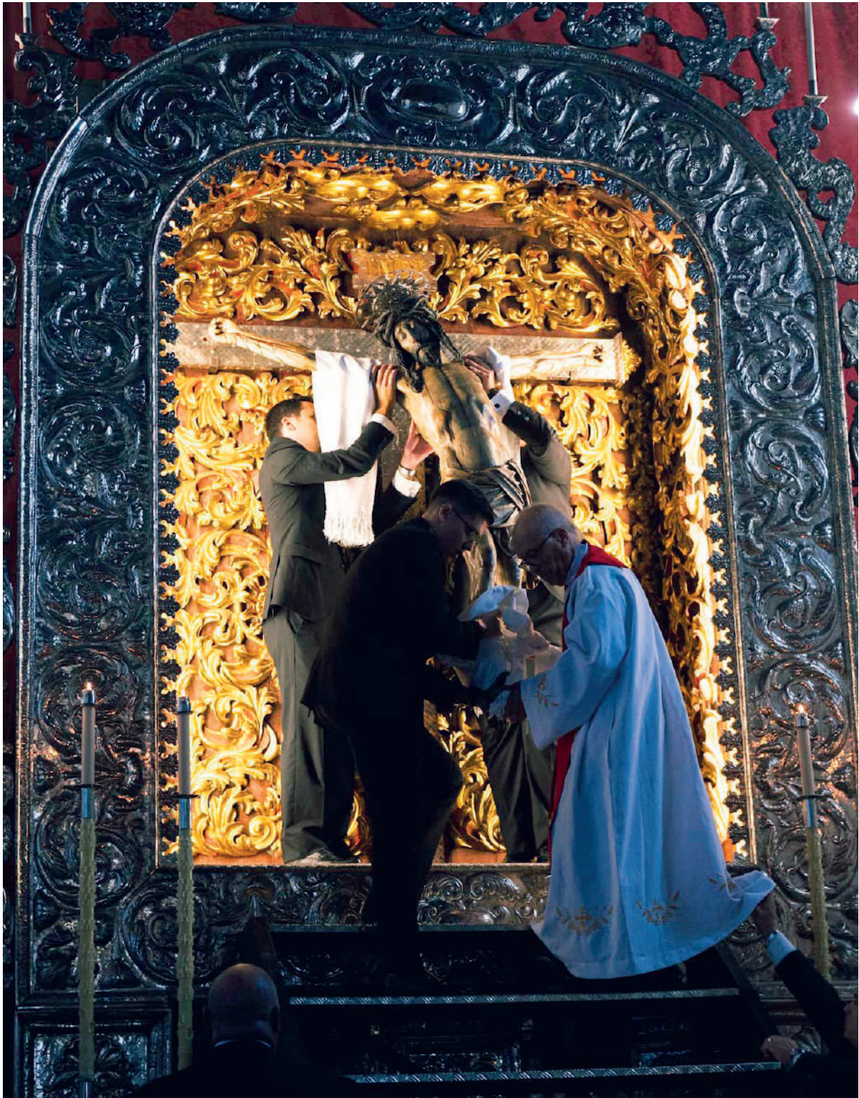
Descendimiento del Santísimo Cristo de La Laguna, 9 de septiembre de 2023.