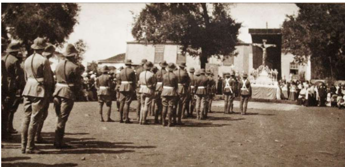
Misa de campaña celebrada al regreso de la Batería.

Pasaron los años y se repitió la salida del Cristo de La Laguna en la contienda civil y en la campaña del Sahara para que sus artilleros pudieran despedirse de su Señor y solicitarle el amparo necesario para afrontar las penalidades que todo conflicto presenta. A cada uno de los componentes se les entregó una estampa con la imagen del Santísimo Cristo que les acompañaría durante toda la campaña.