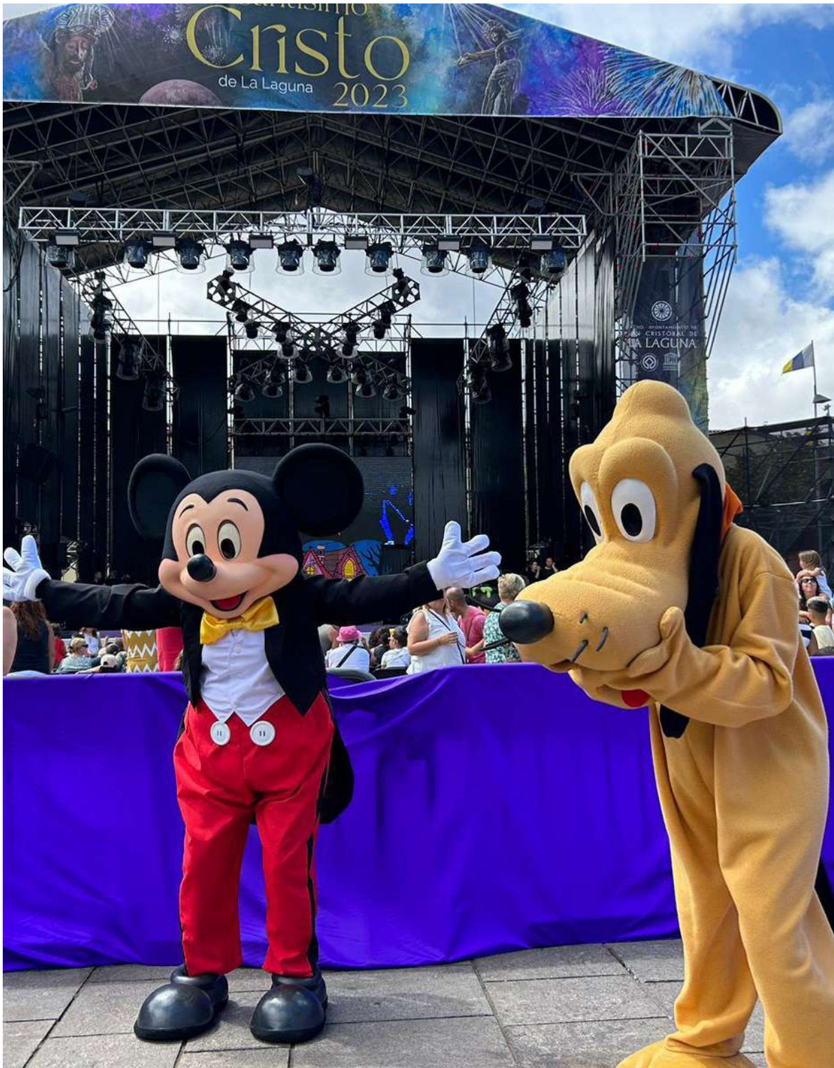
Feria infantil, septiembre 2023.