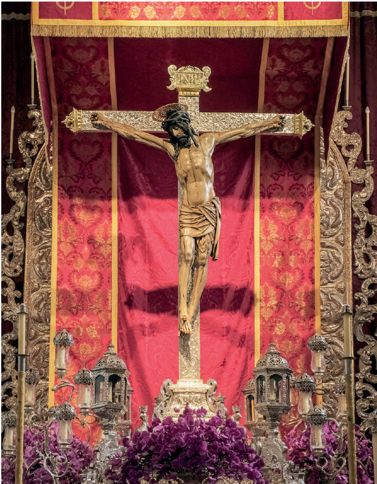
Imagen del Santísimo Cristo de La Laguna en su Real Santuario la tarde del 14 de septiembre de 2023.