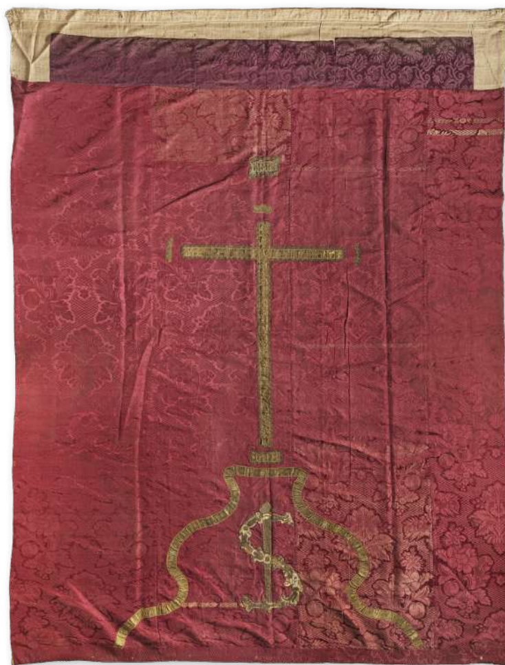
Velo del Santísimo Cristo de La Laguna, ¿segunda mitad del siglo XVI?, Exposición permanente del Stmo. Cristo de La Laguna.

ordinario la Imagen del Santísimo Cristo de La Laguna como estandarte, Santo símbolo que otorgó bravura a los cristianos defensores, despojándoles de todo temor ante la armada luterana. Finalmente un fuerte temporal hizo desistir al enemigo del ataque, hecho insólito e inesperado que contribuiría a la devoción por la milagrosa Imagen.