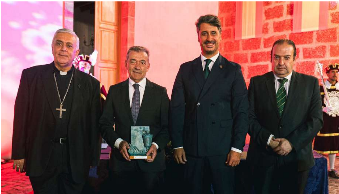
Acto de lectura del pregón de las Fiestas del Santísimo Cristo de La Laguna 2023.